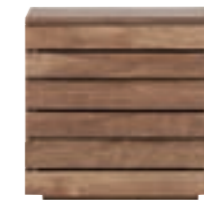
10604 - night stand, 3 drawers 55 x 40 x 54 cm