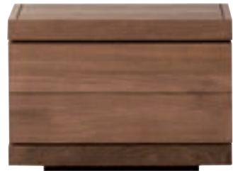
15061 - nightstand, 1 drawer 56 x 40 x 39 cm