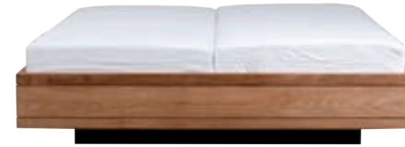
15063 - bed, without slats 160 x 200 x 39 cm