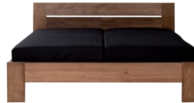
15101 - bed, without slats 180 x 200 x 90 cm