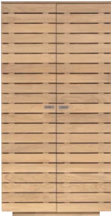
51045 - dresser basic, 2 doors 100 x 60 x 195 cm