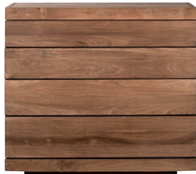
15327 - chest of drawers, 4 drawers 100 x 50 x 90 cm