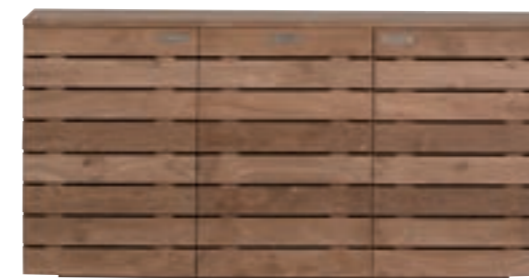
10607 - sideboard, 3 doors 150 x 45 x 75 cm