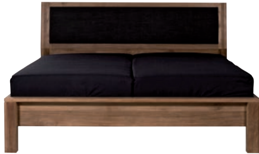
15090 - bed, without slats, Turkish Coffee 160 x 200 x 110 cm