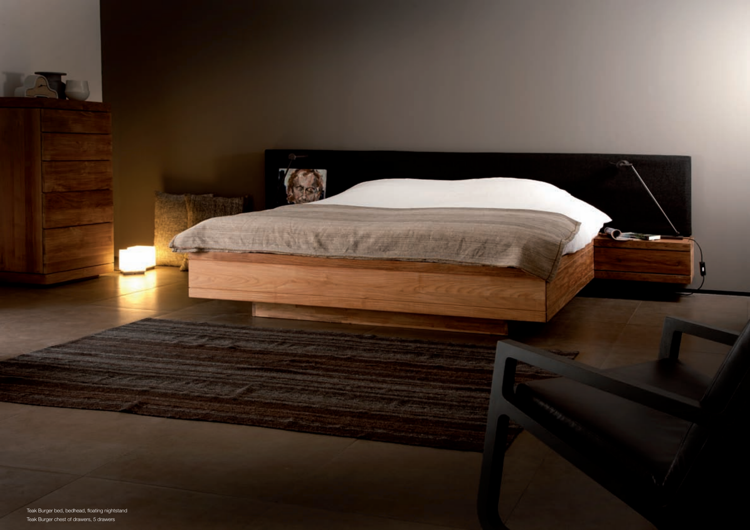
Teak Burger bed, bedhead, floating nightstand Teak Burger chest of drawers, 5 drawers