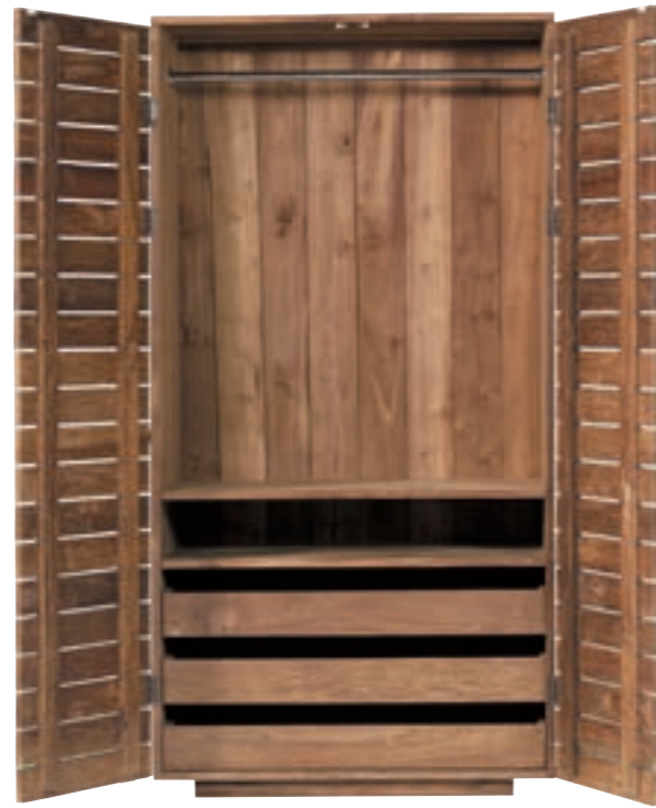
10600 - dresser, 2 doors / 3 drawers 100 x 60 x 195 cm