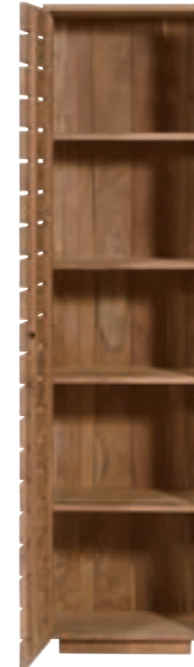
10612 - locker, 1 door, hinge left 50 x 45 x 195 cm