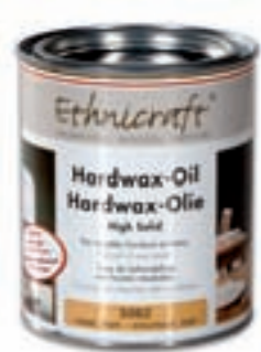
19902 - Ethnicraft Hardwax oil natural mat box of 4 tins (750ml/tin)

Il mobilio di Ethnicraft è studiato per l'interno.