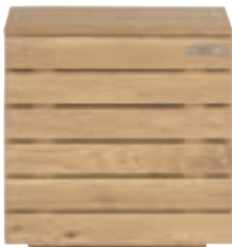
51040 - night stand, 1 door, hinge left 55 x 40 x 55 cm