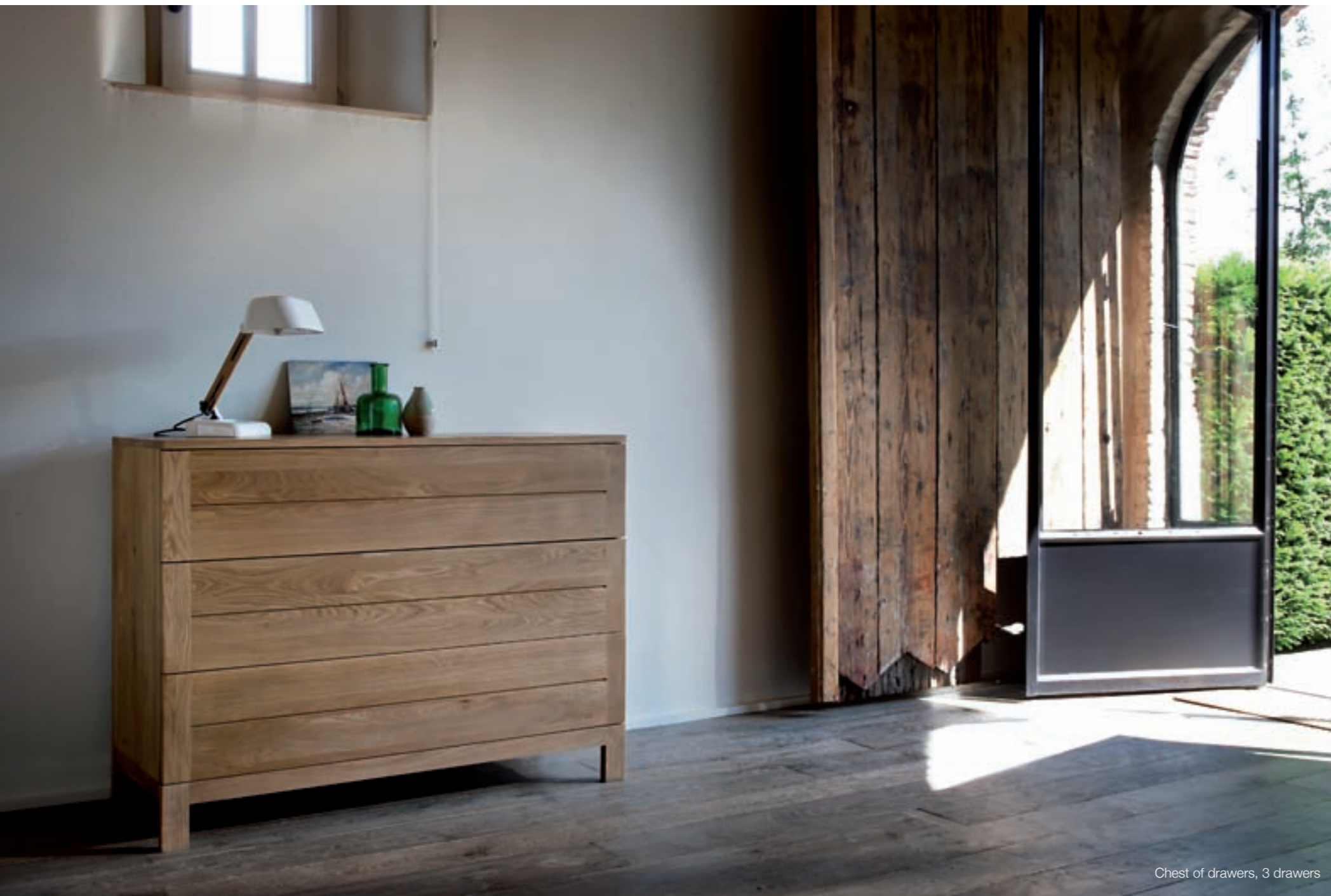
Chest of drawers, 3 drawers