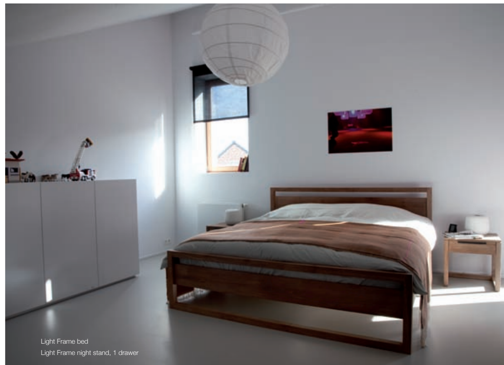
Light Frame bed