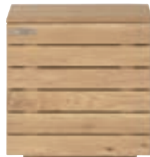
51041 - night stand, 1 door, hinge right 55 x 40 x 55 cm