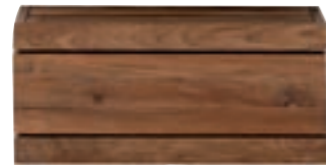
15060 - nightstand floating, 1 drawer, wall hanging 56 x 45 x 26 cm