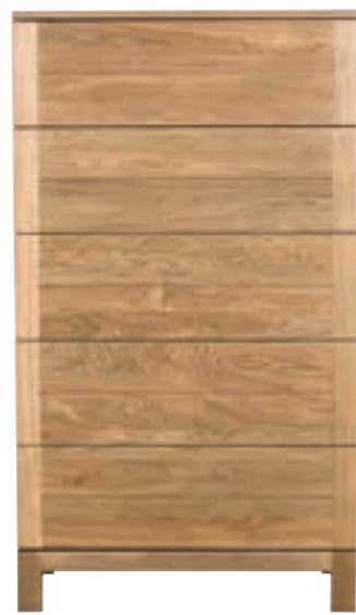
51138 - chest of drawers, 5 drawers 80 x 50 x 141 cm