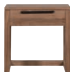
11127 - night stand, 1 drawer 48 x 44 x 48 cm