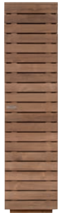
10613 - locker, 1 door, hinge right 50 x 45 x 195 cm