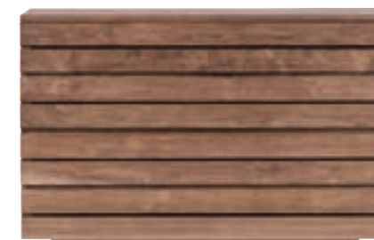
10601 - chest of drawers, 4 drawers 125 x 50 x 80 cm