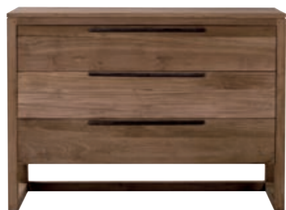
11125 - chest of drawers, 3 drawers 125 x 50 x 90 cm