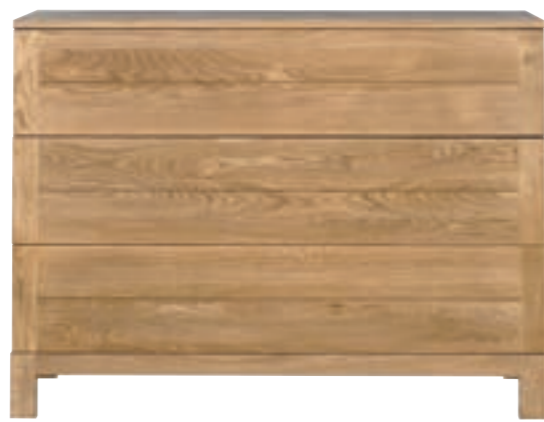
51139 - chest of drawers, 3 drawers 120 x 50 x 92 cm