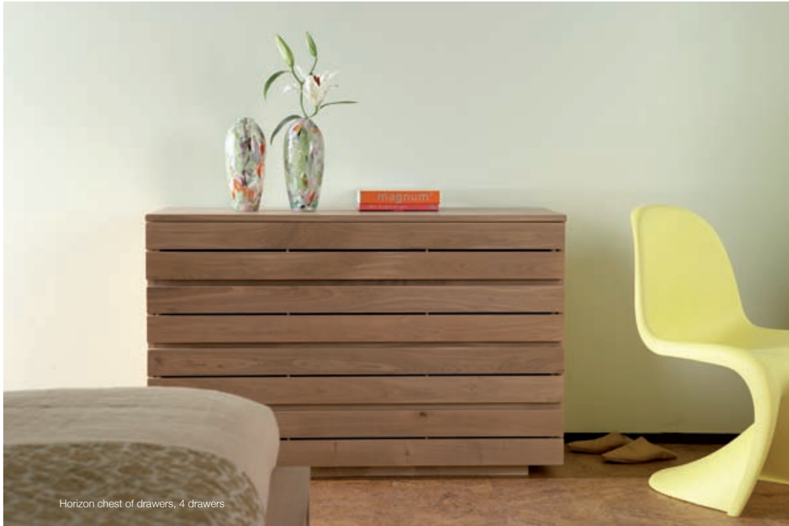
Horizon chest of drawers, 4 drawers