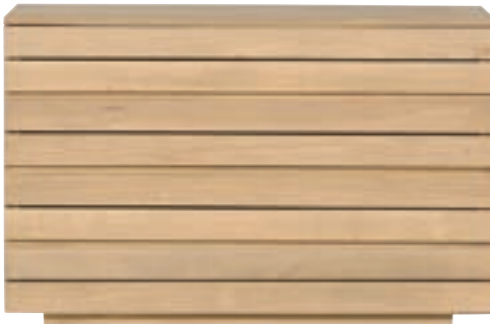
51043 - chest of drawers, 4 drawers 125 x 50 x 80 cm