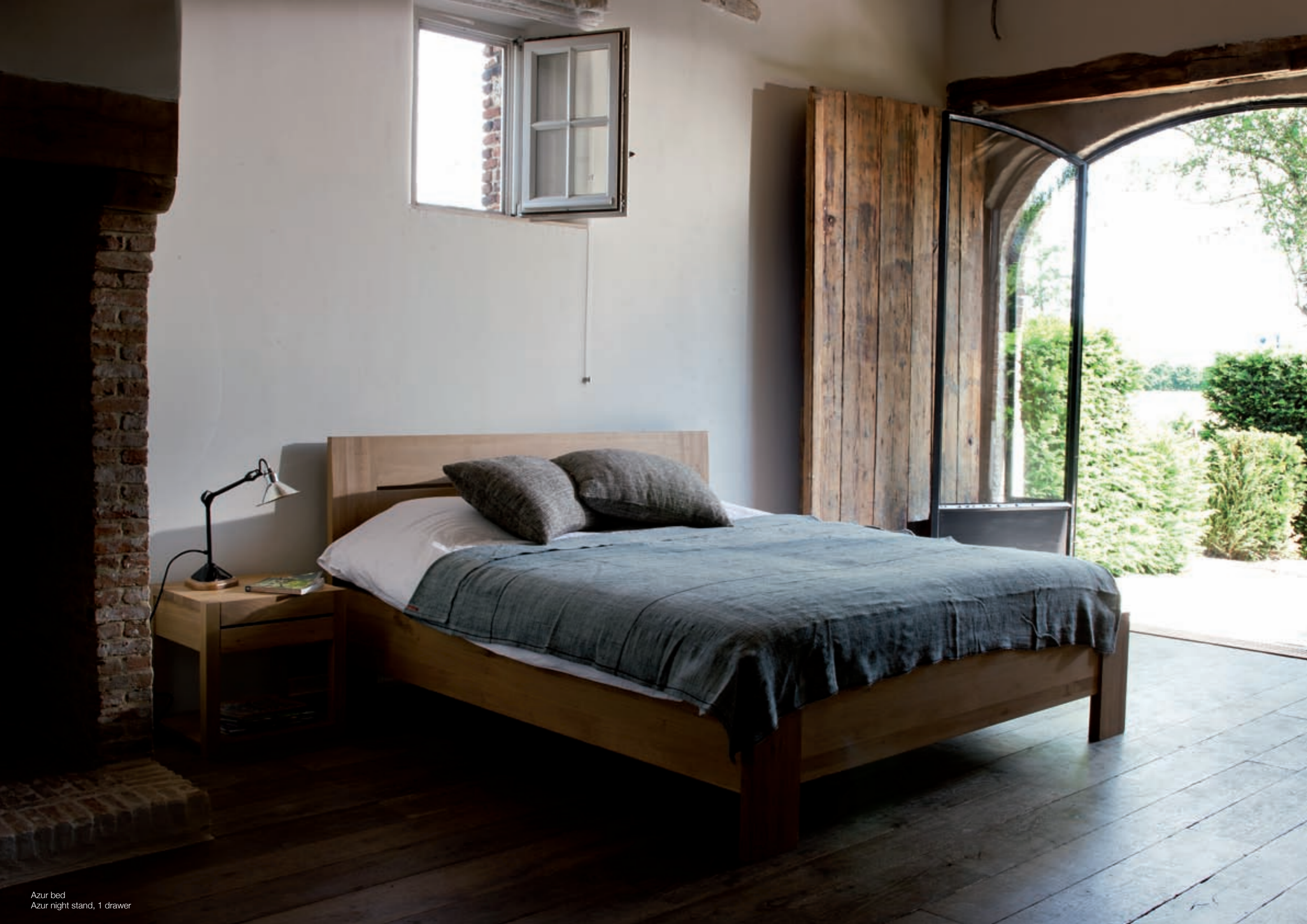
Azur bed Azur night stand, 1 drawer