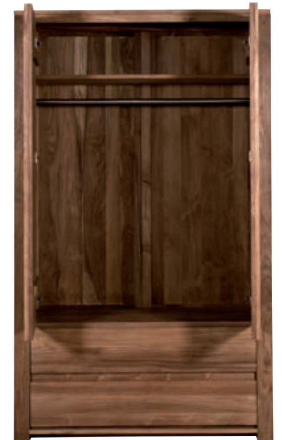
15085 - knockdown dresser, 2 doors / 2 drawers 126 x 60 x 215 cm