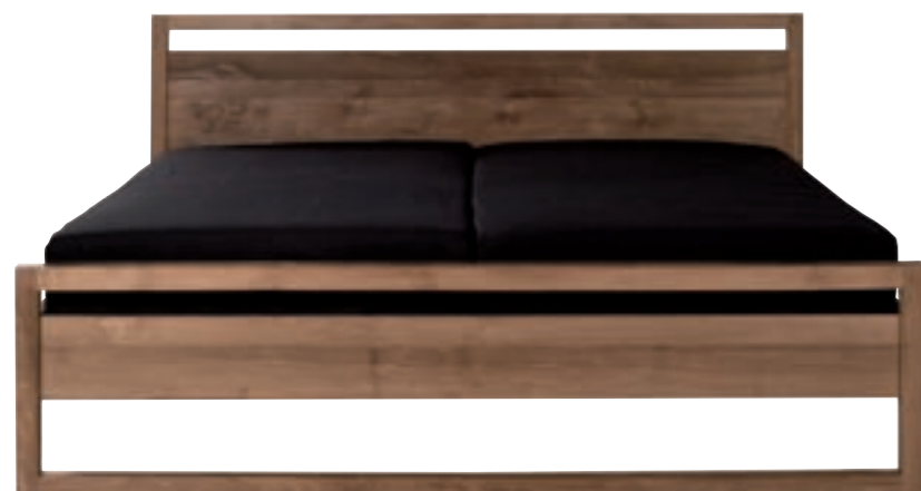
11130 - bed, without slats 160 x 200 x 95 cm