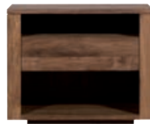
15087 - night stand, 1 drawer 62 x 45 x 50 cm