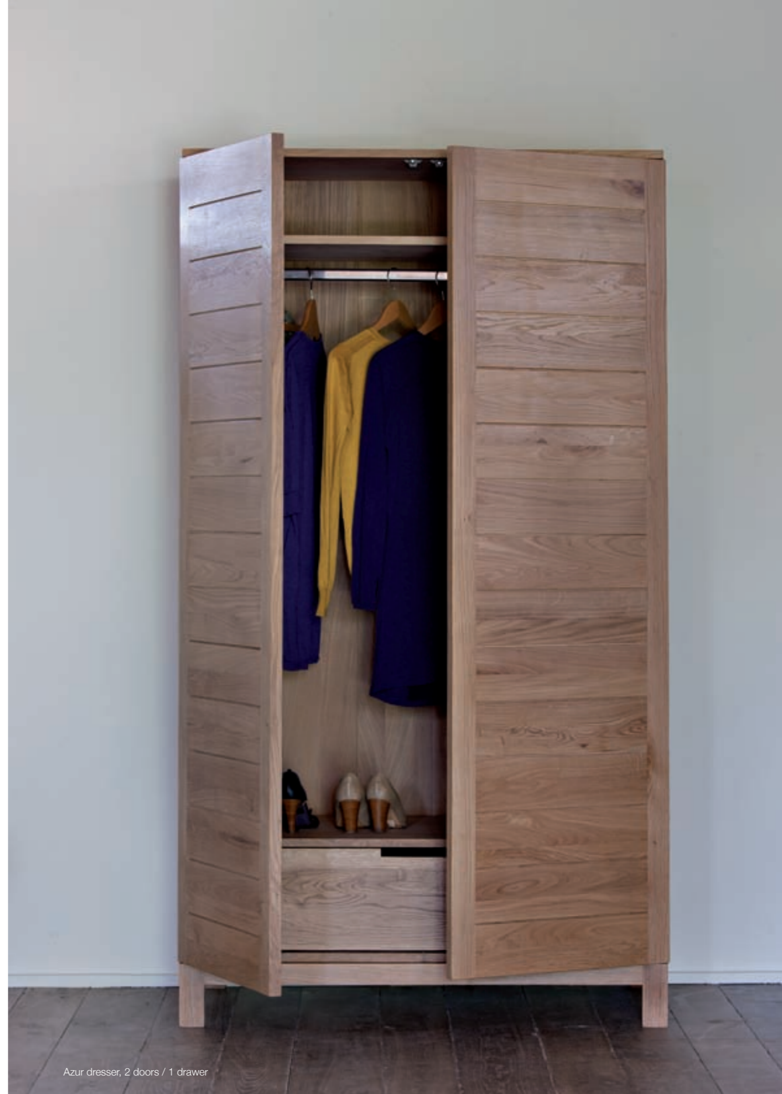
Azur dresser, 2 doors / 1 drawer