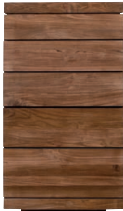
15062 - chest of drawers, 5 drawers 70 x 50 x 125 cm