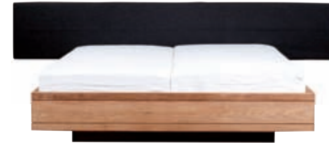
15063 - bed, without slats 160 x 200 x 39 cm