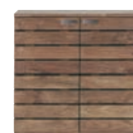
10605 - shoe rack, 2 doors / 1 drawer 80 x 40 x 75 cm