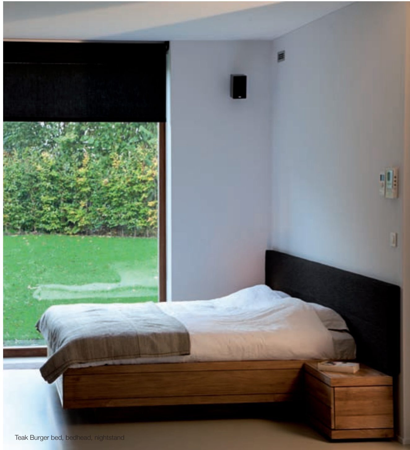
Teak Burger bed, bedhead, nightstand