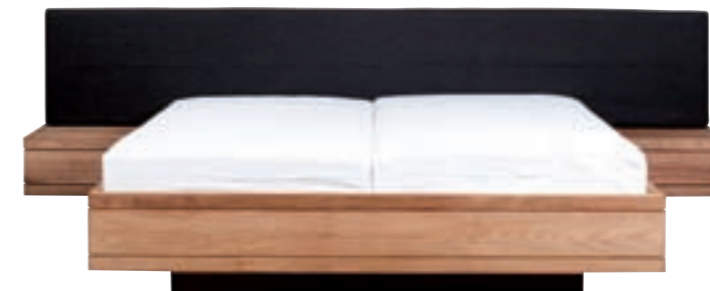
15063 - bed, without slats 160 x 200 x 39 cm