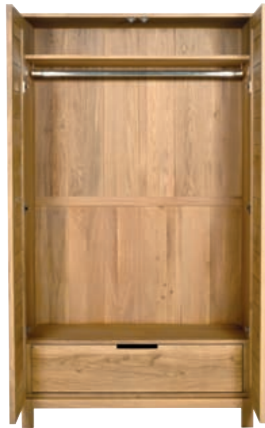
51137 - dresser, 2 doors / 1 drawer 115 x 60 x 205 cm