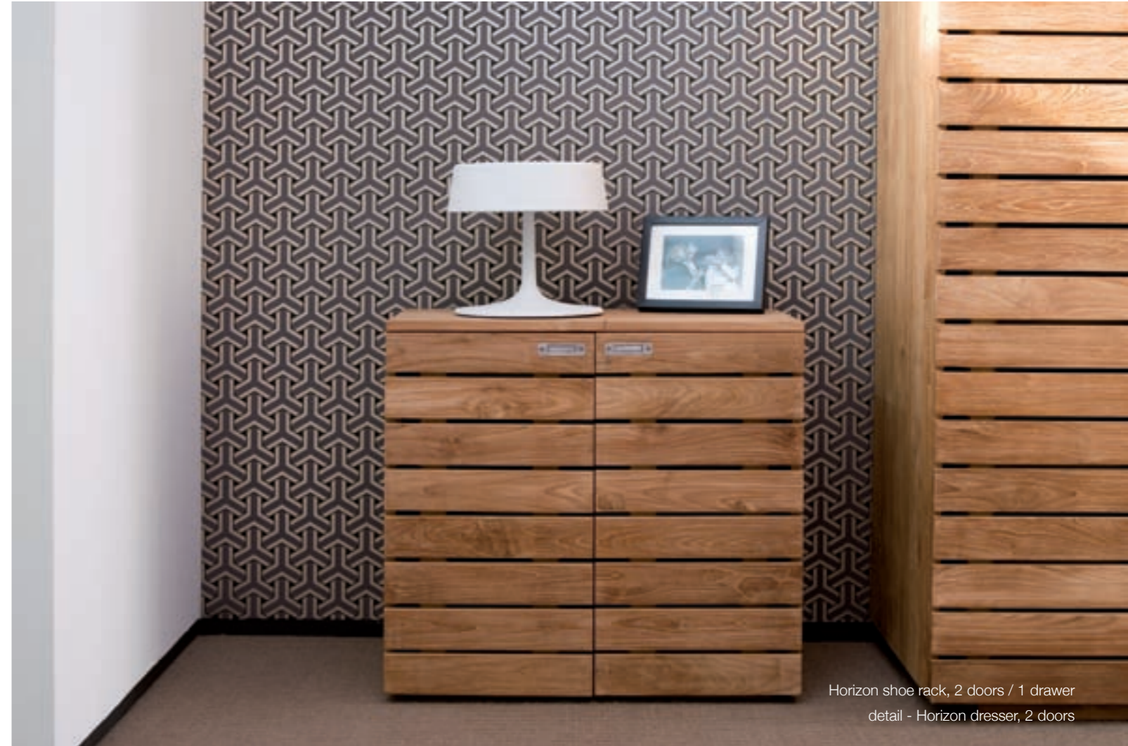
Horizon shoe rack, 2 doors / 1 drawer detail - Horizon dresser, 2 doors