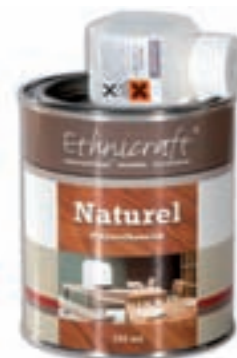
19904 - Ethnicraft water-based Polyurethane varnish mat box of 6 tins (750ml/tin)