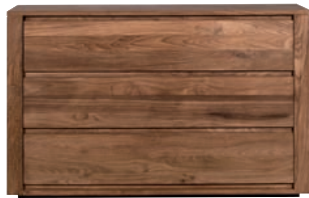
15086 - chest of drawers, 3 drawers 130 x 50 x 83 cm