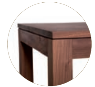
detail - KUBUS, dining table