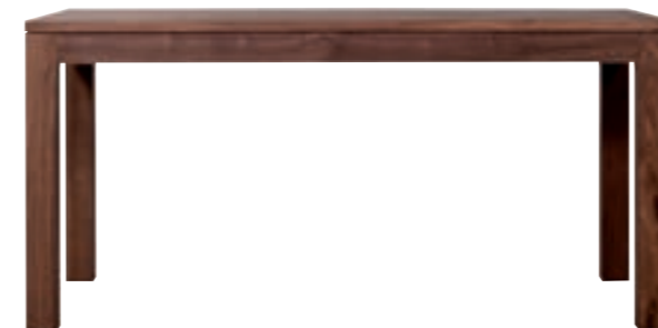
KUBUS, dining table, legs 8 x 8 cm KUBUS, dining table, legs 10 x 10 cm 42012 - 150 x 150 x 78 cm 42004 - 200 x 100 x 78 cm 42002 - 160 x 90 x 78 cm 42006 - 220 x 105 x 78 cm 42003 - 180 x 90 x 78 cm 42007 - 250 x 105 x 78 cm