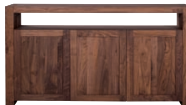
41055 - sideboard, 3 doors 166 x 45 x 91 cm