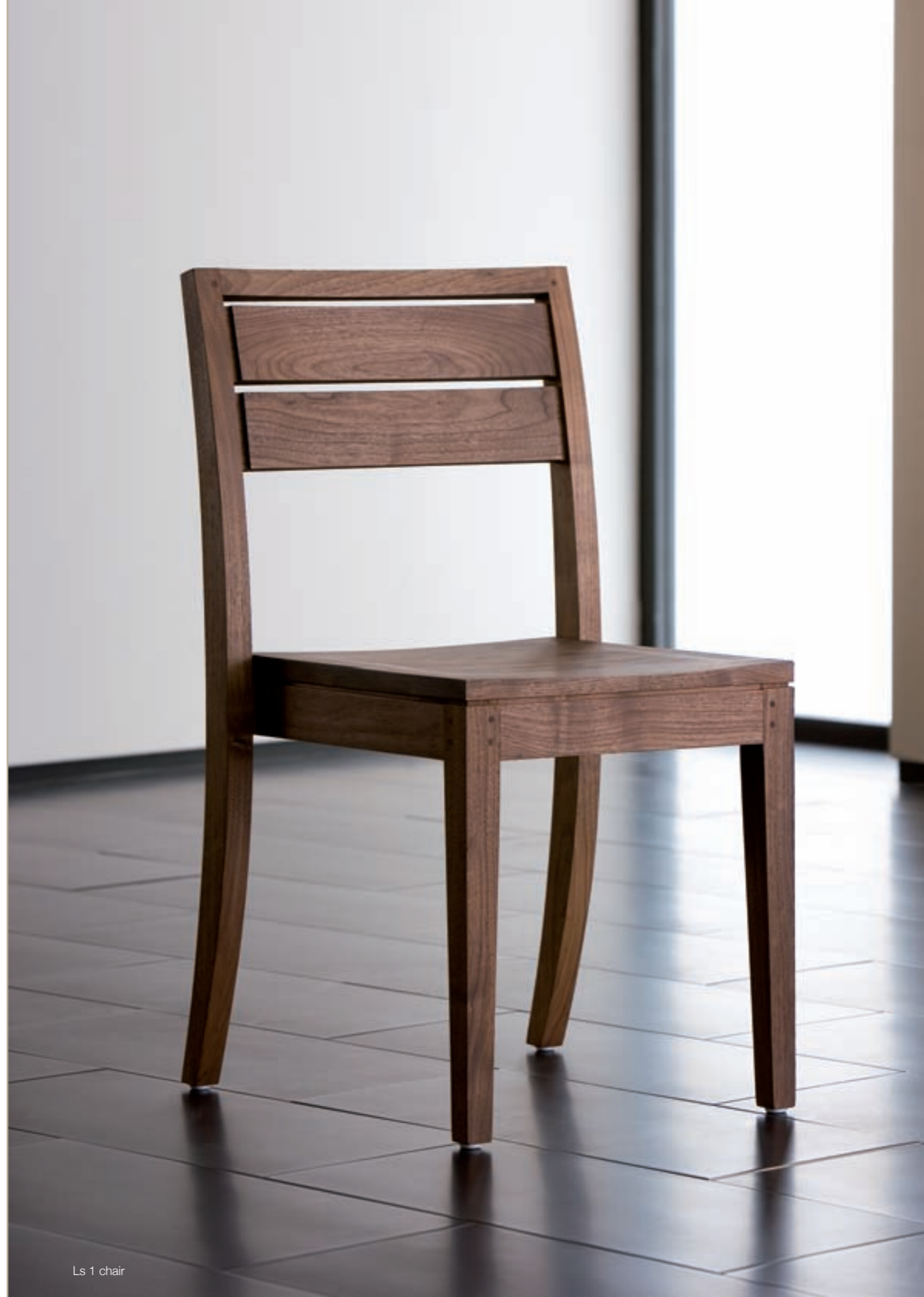
Ls 1 chair