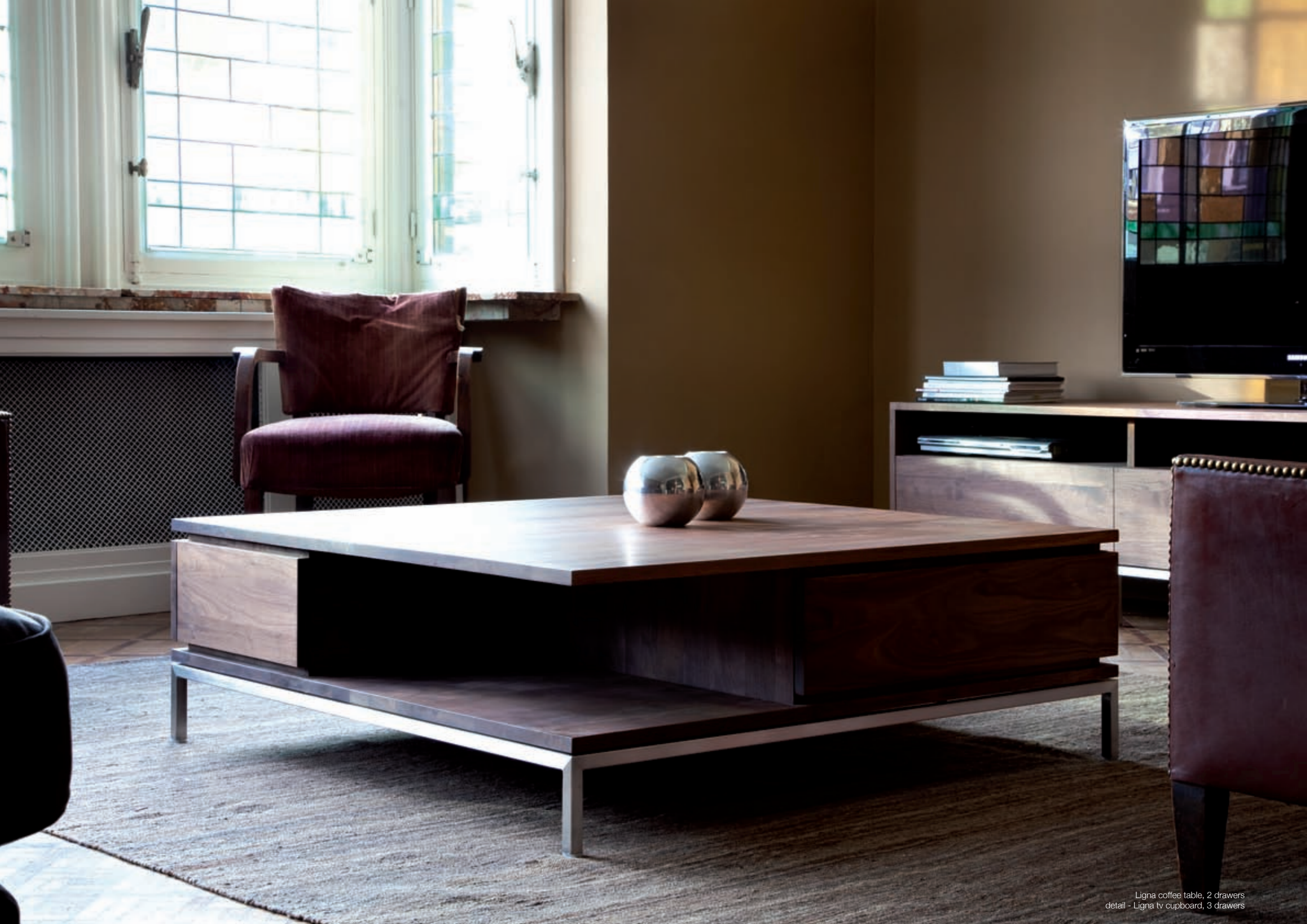
Ligna coffee table, 2 drawers detail - Ligna tv cupboard, 3 drawers