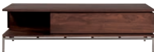
41117 - coffee table, 2 drawers 130 x 80 x 37 cm