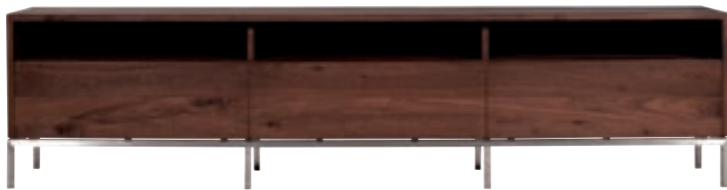
41116 - tv cupboard, 3 drawers 210 x 45 x 52 cm