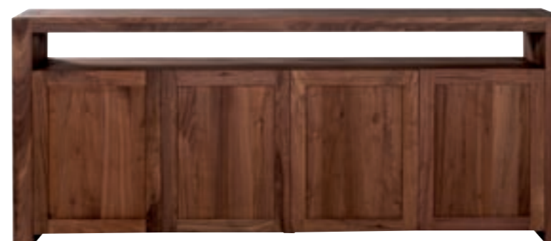
41056 - sideboard, 4 doors 216 x 45 x 91 cm