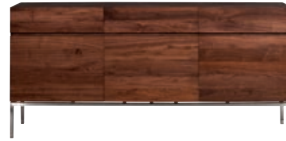
41110 - sideboard, 3 doors / 3 drawers 165 x 45 x 78 cm