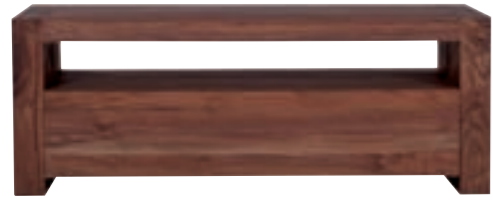
41058 - tv cupboard, 1 drawer 120 x 55 x 45 cm