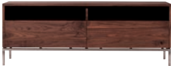
41115 - tv cupboard, 2 drawers 142 x 45 x 52 cm