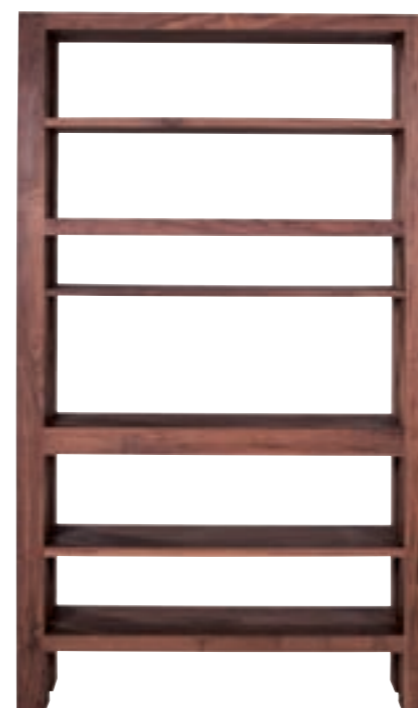
41100 - rack 116 x 40 x 200 cm