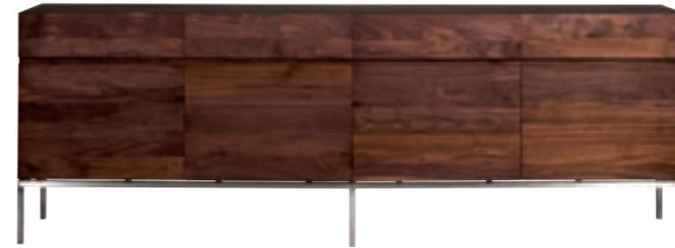
41111 - sideboard, 4 doors / 4 drawers 221 x 45 x 78 cm