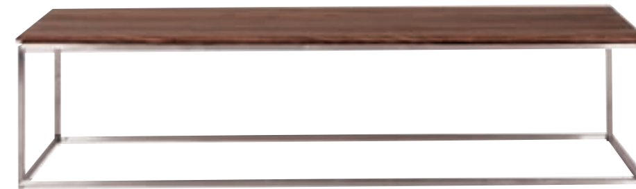
THIN, coffee table 42904 - 120 x 70 x 30 cm