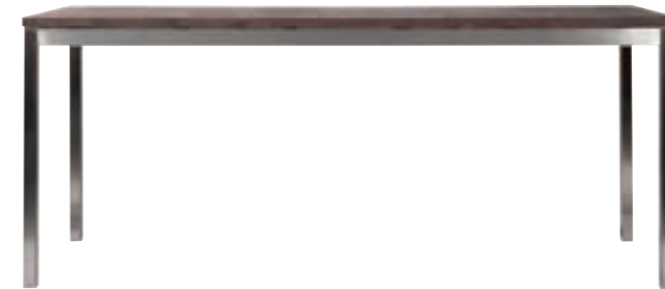
BASIC STAINLESS STEEL, dining table, legs 4 x 4 cm 42027 - 150 x 150 x 76 cm 42021 - 160 x 90 x 76 cm 42022 - 180 x 90 x 76 cm 42023 - 200 x 100 x 76 cm 42024 - 220 x 100 x 76 cm