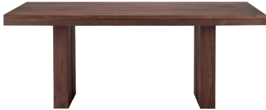
41067 - dining table 180 x 90 x 78 cm