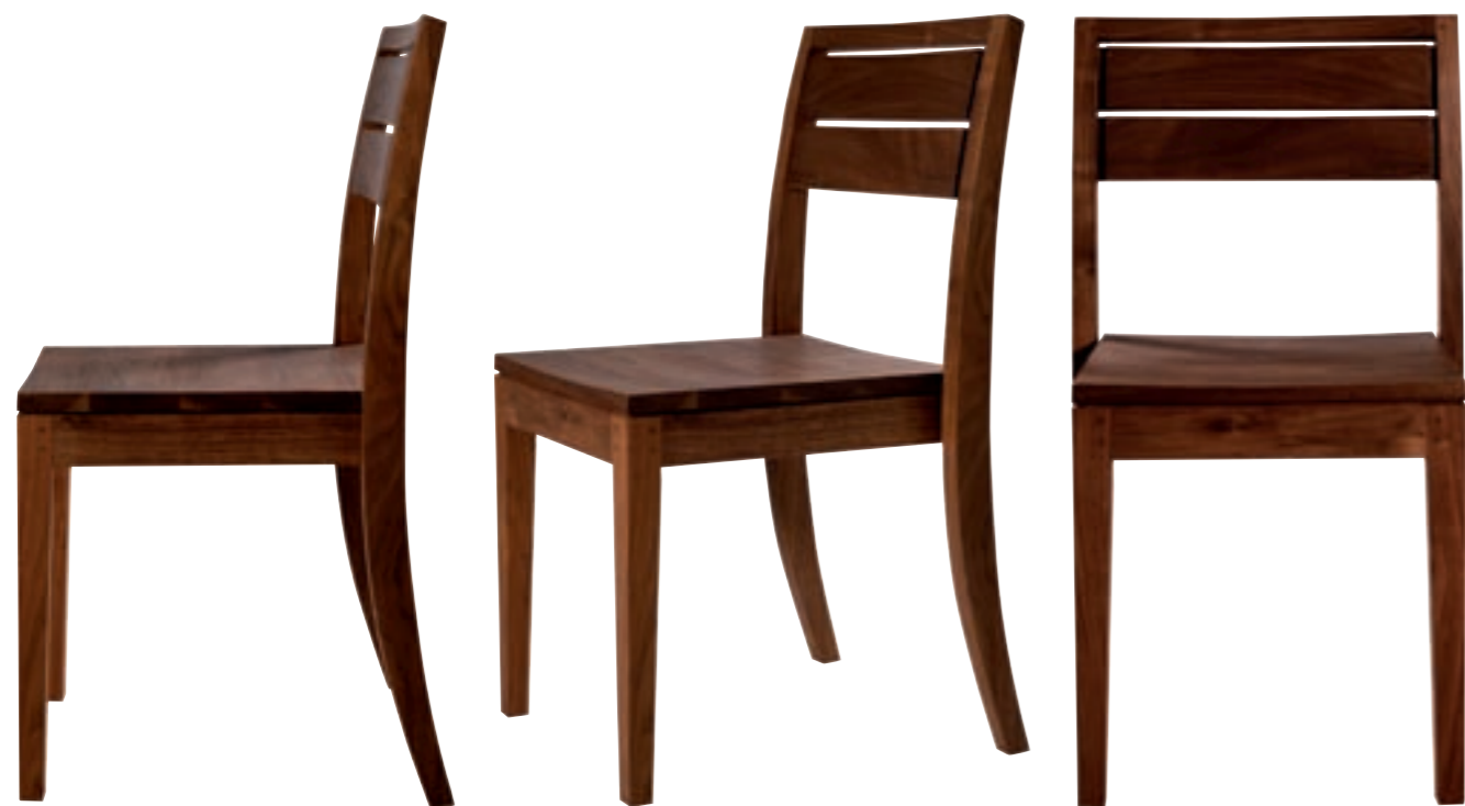
Ls 1, chair 42500 - 47 x 48 x 85 cm