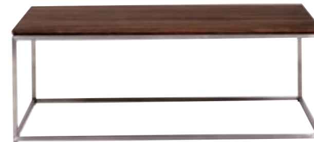
THIN, coffee table 42903 - 80 x 80 x 30 cm