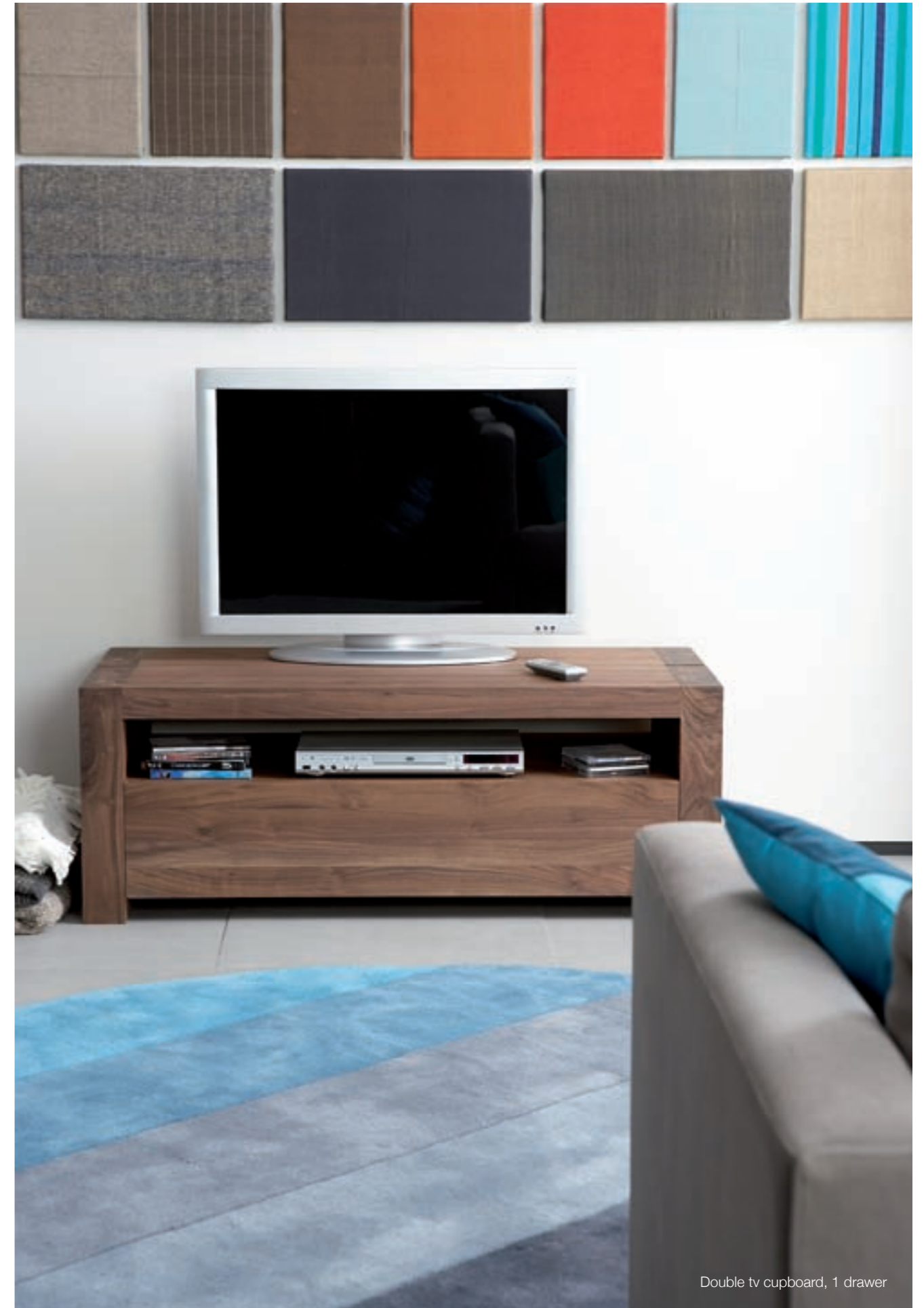
Double tv cupboard, 1 drawer