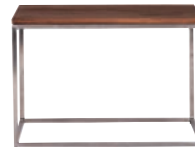
THIN, side table 42905 - 50 x 50 x 35 cm