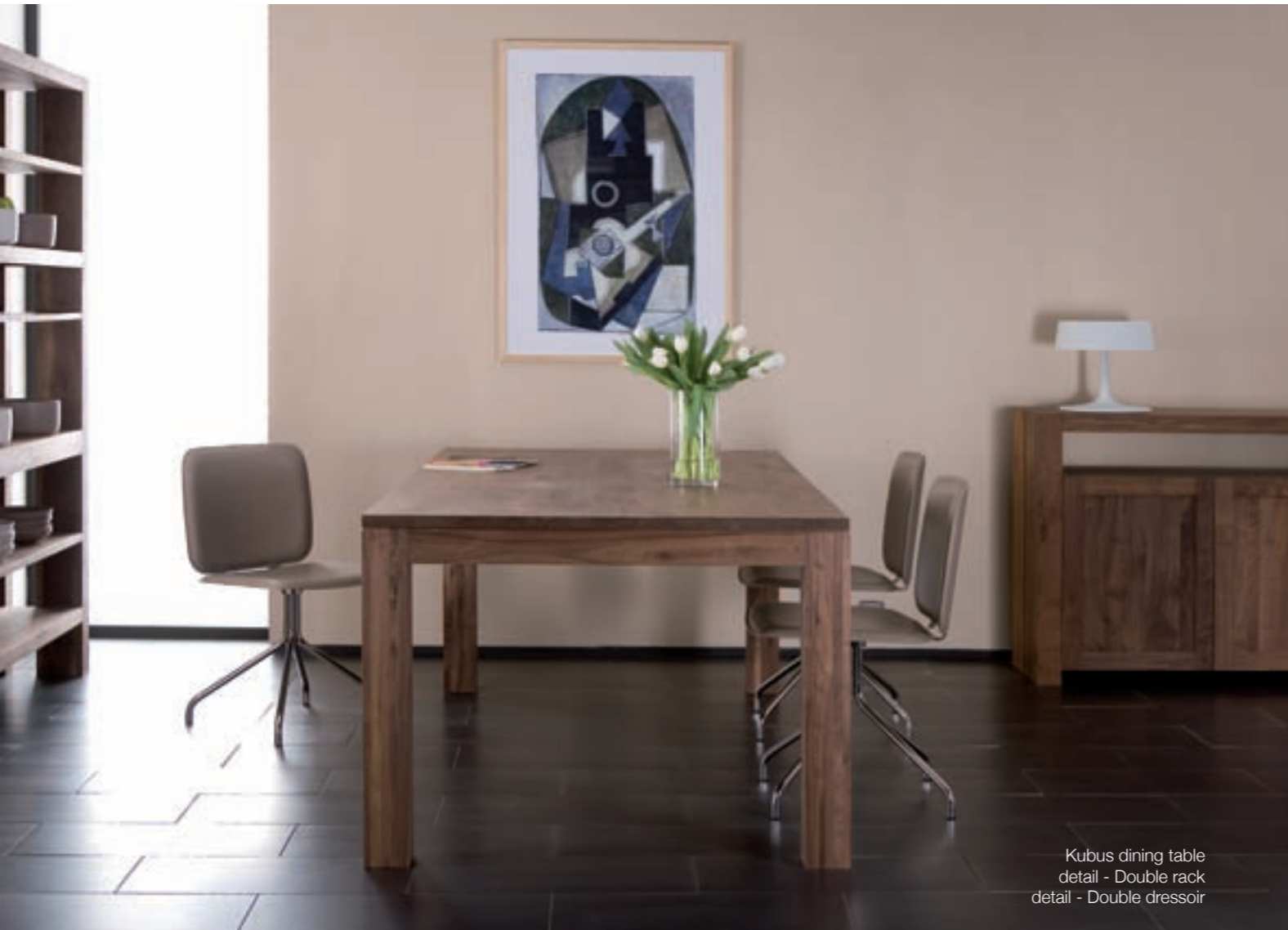
Kubus dining table detail - Double rack detail - Double dressoir