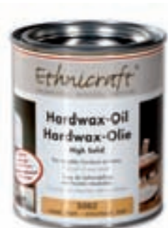
19902 - Ethnicraft Hardwax oil natural mat box of 4 tins (750ml/tin)

Il mobilio di Ethnicraft è studiato per l'interno.