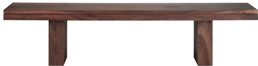
41084 - bench 180 x 40 x 45 cm