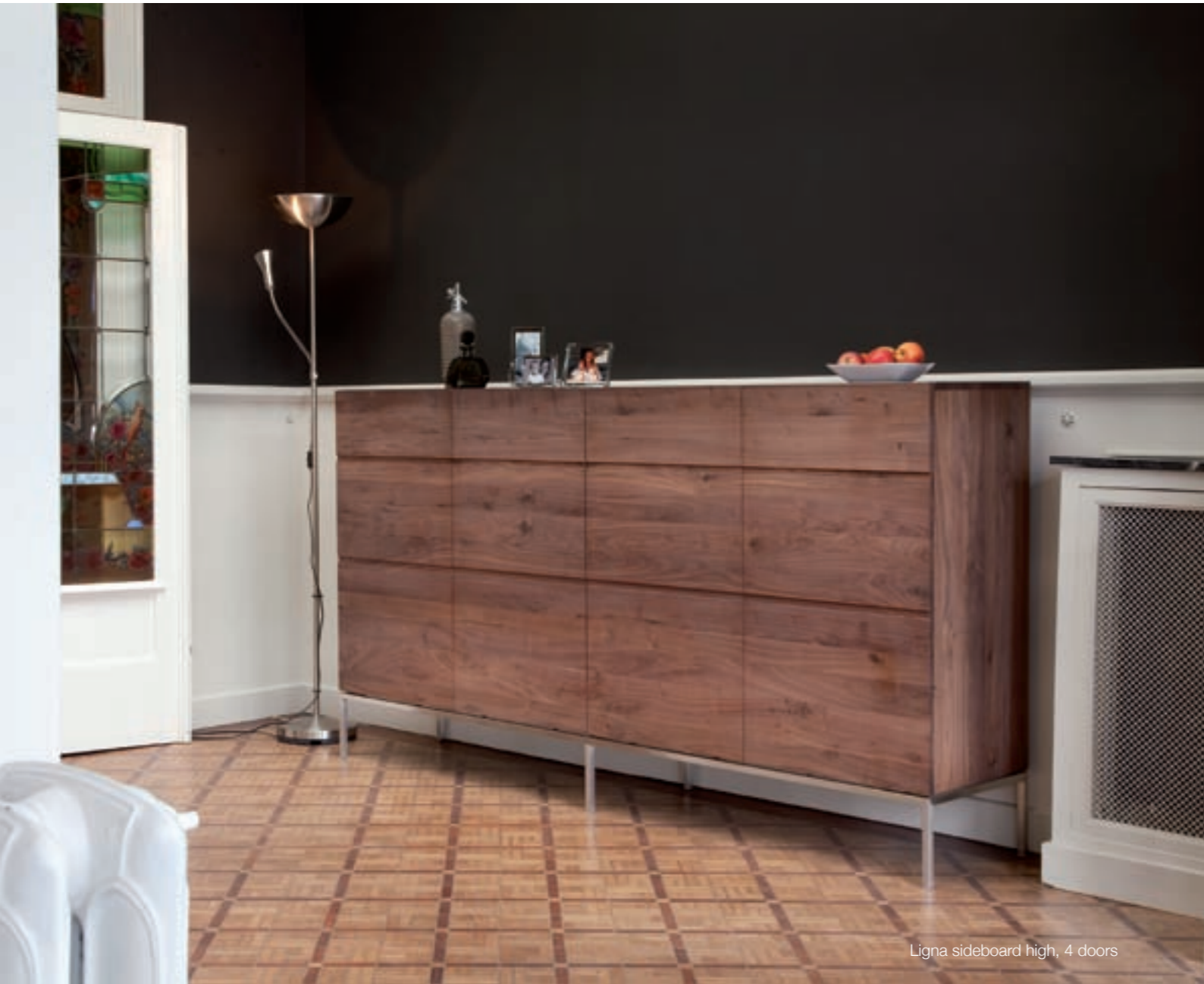
Ligna sideboard high, 4 doors