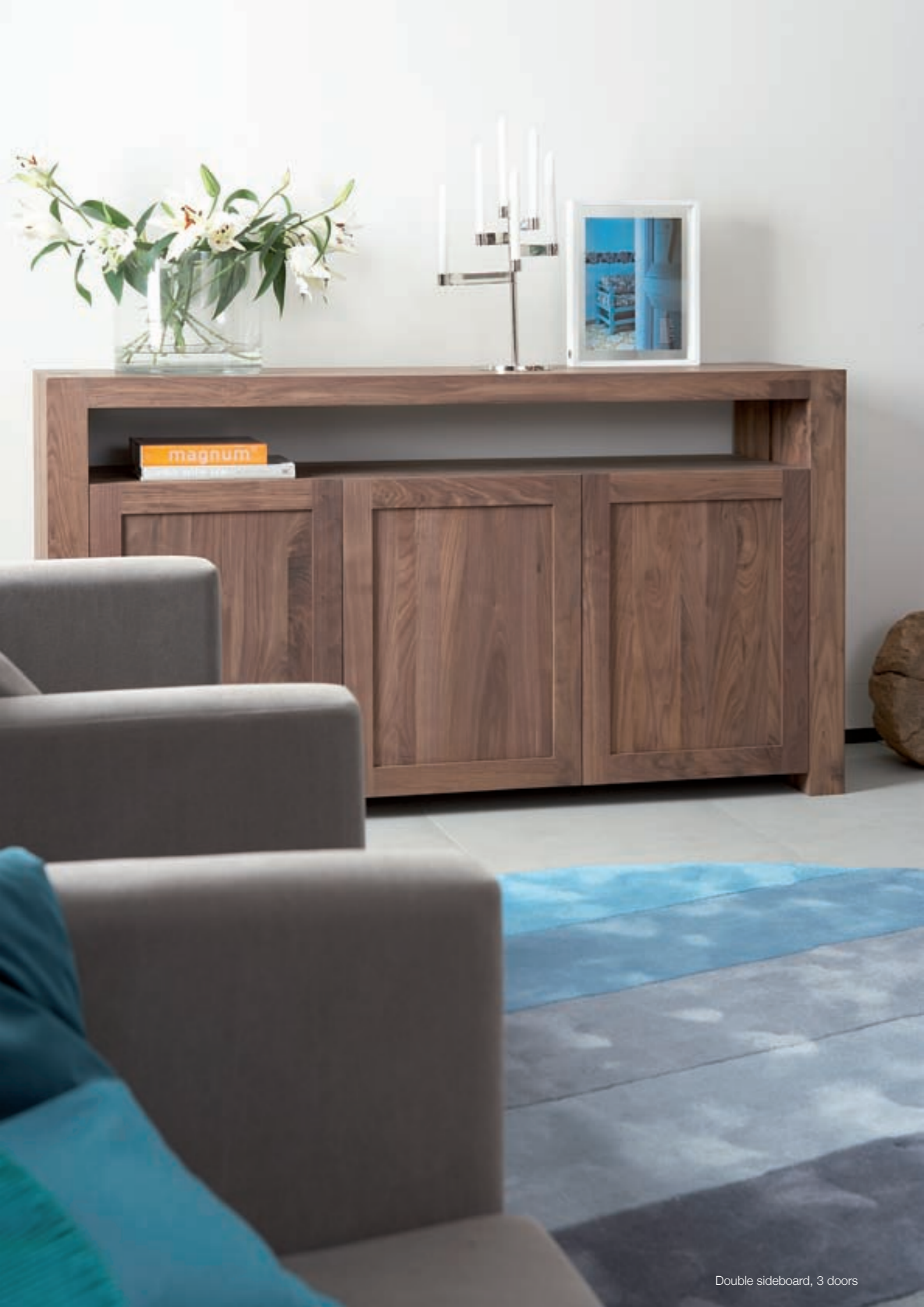
Double sideboard, 3 doors