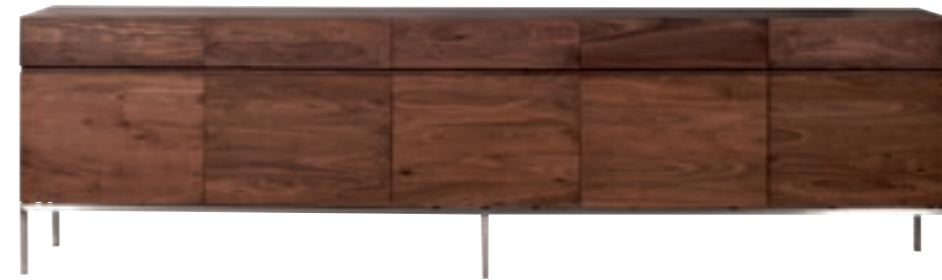
41112 - sideboard, 5 doors / 5 drawers 275 x 45 x 78 cm