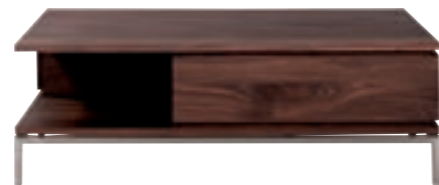
41118 - coffee table, 2 drawers 110 x 110 x 37 cm