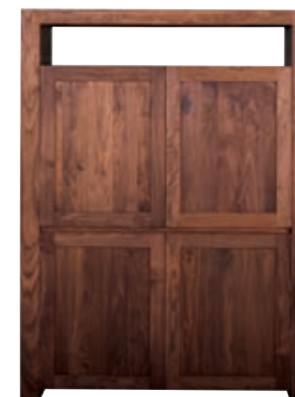
41061 - storage cupboard, 4 doors 116 x 45 x 160 cm