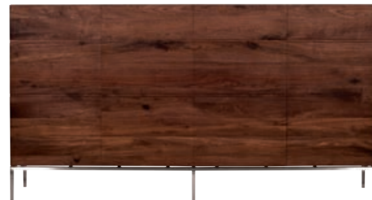
41113 - sideboard high, 4 doors 221 x 45 x 120 cm